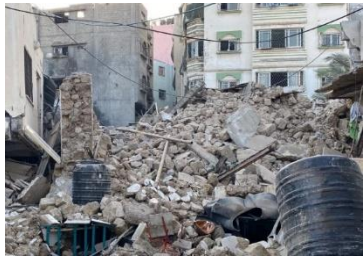
Le 19 octobre, un missile a frappé cette salle de l'église orthodoxe grecque Saint-Porphyrus à Gaza, tuant au moins 18 des 400 civils qui s'y réfugiaient (Caritas Jérusalem).

* Crise de Gaza : Un appel à l'aide, un appel à la paix Développement et Paix - Caritas Canada alloue immédiatement 150 000 $ à Caritas Jérusalem pour l'aider à répondre aux besoins des familles assiégées et déplacées par la crise actuelle à Gaza en Terre Sainte. En tant que membre de la Banque de céréales vivrières du Canada, Développement et Paix - Caritas Canada participe également à l'appel d'urgence humanitaire de la Coalition humanitaire pour Gaza. Cela signifie que les dons pour cette cause seront égalés dollar pour dollar par le gouvernement du Canada jusqu'à un maximum de 10 millions de dollars jusqu'au 12 novembre. Nous invitons donc les Canadiens à faire des dons généreux.